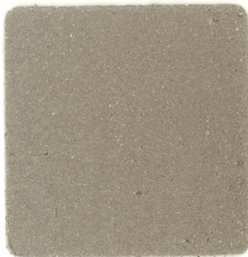
MALTA FRIBRORINFORZATA TIXOTROPICA ANTIRITIRO

Pittura acrilica di finitura specifica per la protezione dei manufatti in cemento armato esposti alle intemperie, anche in ambienti marino e industriale aggressivo.